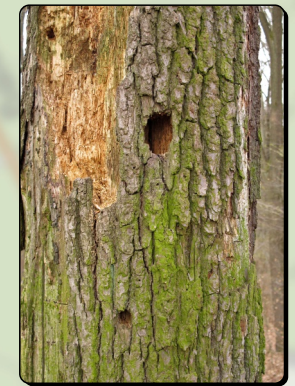
(7) Alt- und Totholzinsel