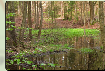
(6) Feuchtgebiet Erlenbruch